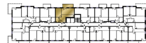
Ustawienie budynku względem kierunków świata