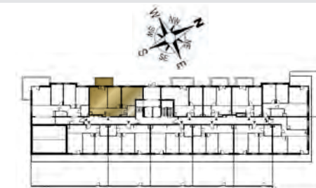
Ustawienie budynku względem kierunków świata