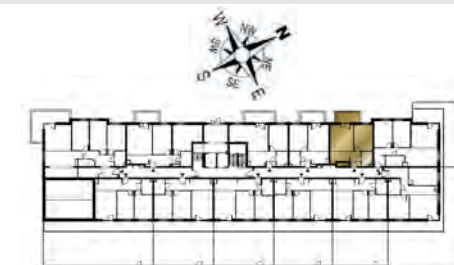
Ustawienie budynku względem kierunków świata