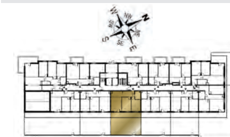
Ustawienie budynku względem kierunków świata