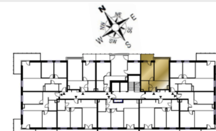
Ustawienie budynku względem kierunków świata