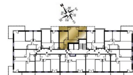
Ustawienie budynku względem kierunków świata