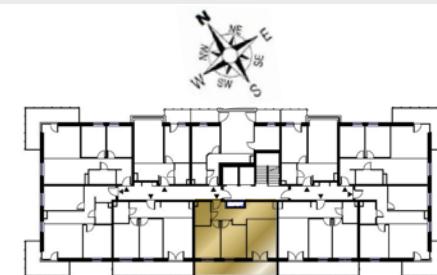
Ustawienie budynku względem kierunków świata