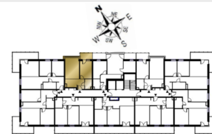
Ustawienie budynku względem kierunków świata