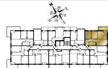
Ustawienie budynku względem kierunków świata