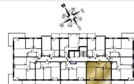
Ustawienie budynku względem kierunków świata