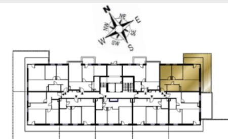
Ustawienie budynku względem kierunków świata