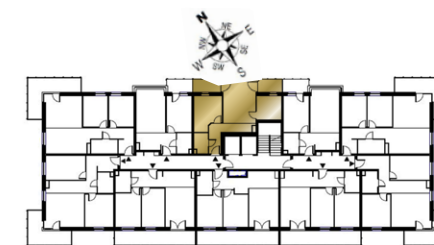
Ustawienie budynku względem kierunków świata