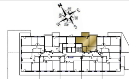
Ustawienie budynku względem kierunków świata