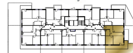
Ustawienie budynku względem kierunków świata