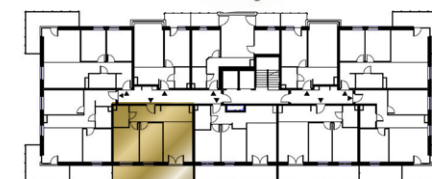
Ustawienie budynku względem kierunków świata