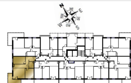
Ustawienie budynku względem kierunków świata