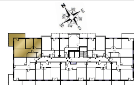
Ustawienie budynku względem kierunków świata