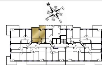
Ustawienie budynku względem kierunków świata