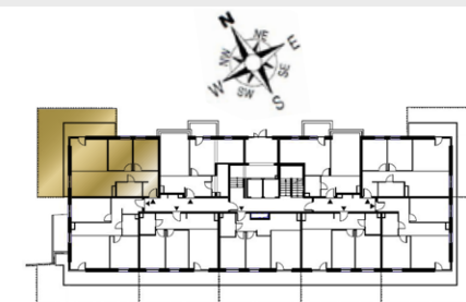
Ustawienie budynku względem kierunków świata